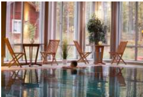
Bassäng med 34-gradigt vatten

Den unika, historiska och naturnära miljön på Sätra Brunn erbjuder en positiv atmosfär för att i gemenskap nå ökad kunskap. Genom att hälsoveckans grupp är begränsad till 12 personer finns också goda möjligheter att möta och lära av andra, som lever i liknande situationer.