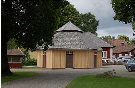
Brunshuset med Trefaldighetskällan