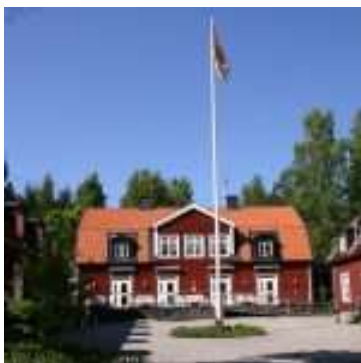
Vi bor och äter våra måltider på Skogsgården