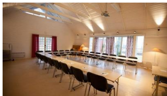
Gruppövningar i "Tysta rummet"