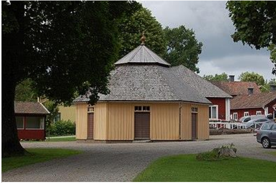
Brunns huset med Trefaldighetskällan