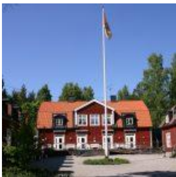
Vi bor och äter våra måltider på Skogsgården