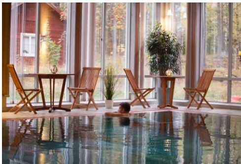
Bassäng med 34-gradigt vatten

Den unika, historiska och naturnära miljön på Sätra Brunn erbjuder en positiv atmosfär för att i gemenskap nå ökad kunskap. Genom att hälsoveckans grupp är begränsad till 12 personer finns också goda möjligheter att möta och lära av andra, som lever i liknande situationer.